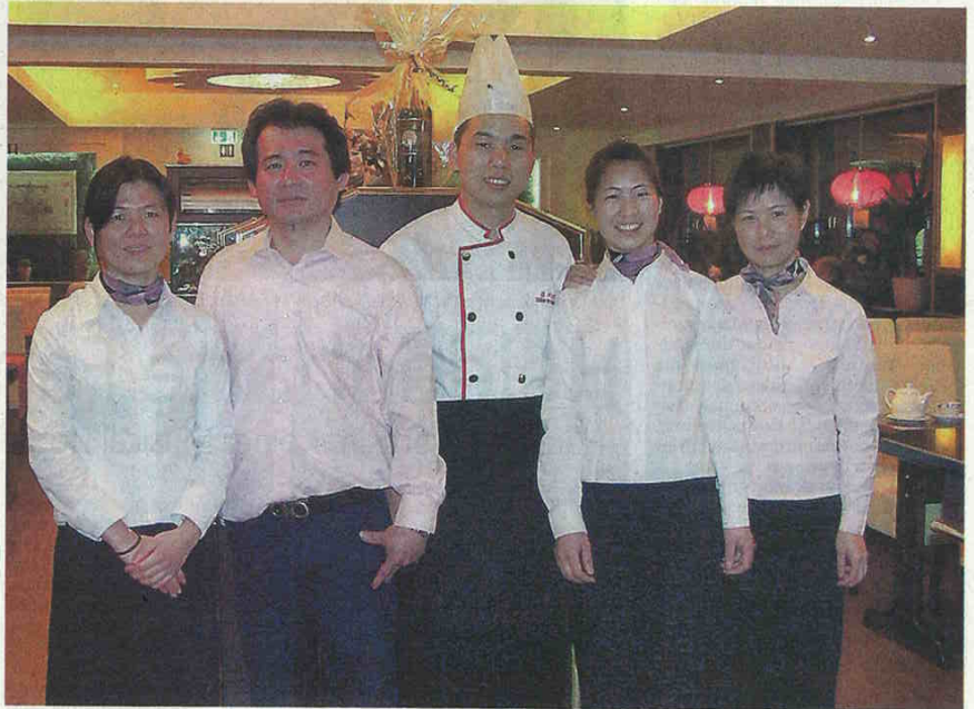
Das Team des „Singapur“ freut sich über den guten Zuspruch des Restaurants, das am 28. Oktober eröffnet wurde.