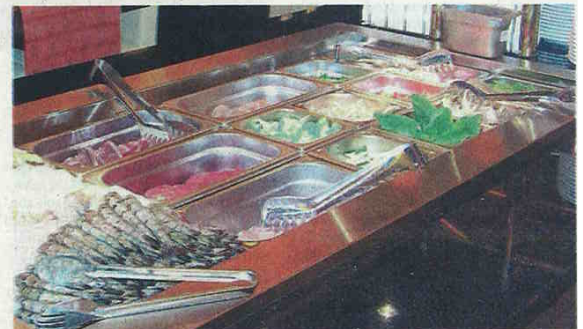
Ein Blick auf das mongolische Büfett, wie es freitagabends lockt.

Natürlich gibt es im neuen „Singapur“ die traditionellen Suppen und scharfen Soßen sowie Vorspei-