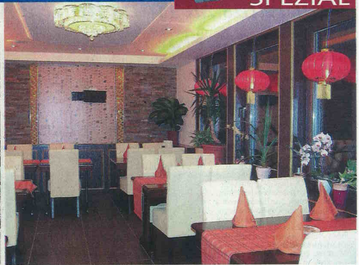
Edel und modern präsentieren sich die komplett umgestalteten Räumlichkeiten mit dem riesigen Büfett als Glanzlicht.